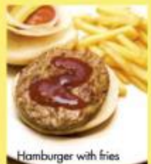
Hamburger with fries