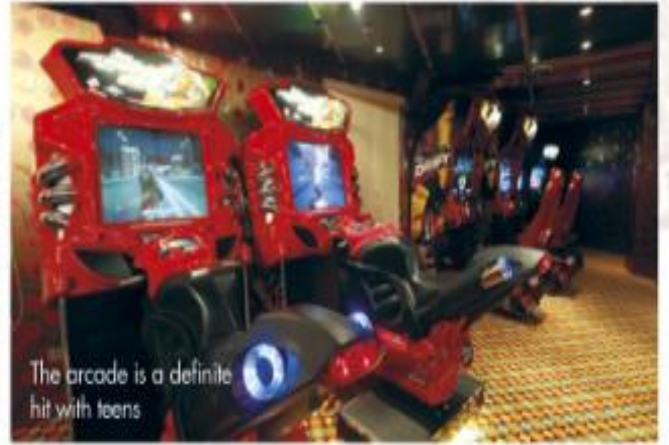
The arcade is a definite hit with teens