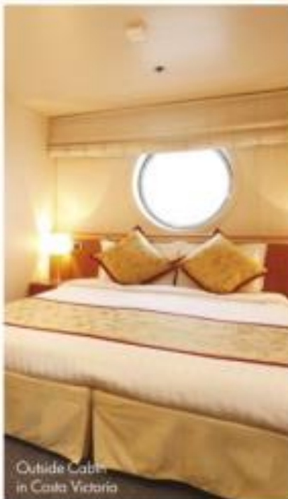
Outside Cabin in Costa Victoria

จากห้องที่มีระเบียงส่วนตัว ไปจนถึงห้องพักแบบไม่มีหน้าต่าง หรือสำราญ COSTA ได้จัดเตรียมห้องพักหลากหลายรูปแบบที่จะตอบสนองความต้องการของทุกท่าน