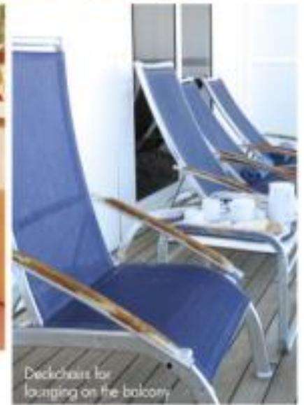
Deck chairs for lounging on the balcony