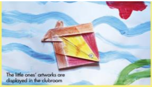
The little ones' artworks are displayed in the clubroom