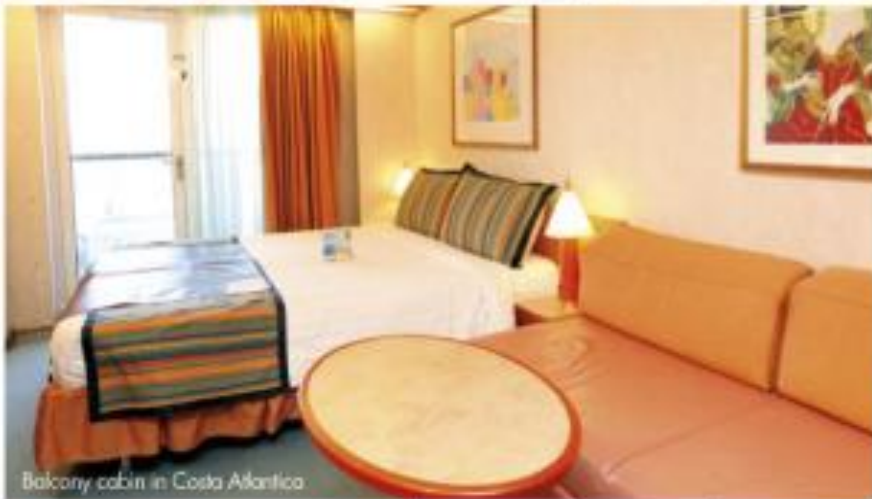
Balcony cabin in Costa Atlantica