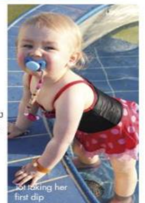
Not taking her first dip