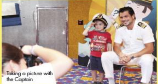
Taking a picture with the Captain

SQUOK CLUB คลับกิจกรรมที่สร้างความสนุกสนานสำหรับเด็กๆ ระหว่างล่องเรือ ซึ่งได้แบ่งออกเป็น สโมสรเด็กเล็ก (3-6 ขวบ) สโมสรเด็กโต (7-11 ขวบ) นำทีมโดยเจ้าหน้าที่ที่ได้รับการอบรมมาเป็นอย่างดี เต็มเปี่ยมด้วยพลัง และความกระตือรือร้น ภายในสโมสรมีกิจกรรมมากมายให้ร่วมสนุกแบบไม่รู้จบ อาทิเช่น การฝึกเดินร่า ปาร์ตี้เครื่องแต่งกาย เกมส่ำลัมบิ๊ด ฯลฯ พ่อแม่อย่าแปลกใจเมื่อสิ้นสุดวันแล้ว เด็กๆ ก็ทั้งหลายจะยังไม่ยอมเลิกและกลับไปพักผ่อน