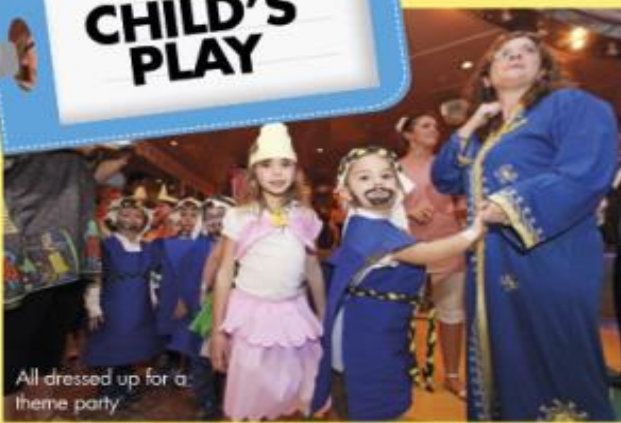
All dressed up for a theme party