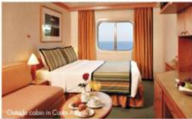
Double cabin in Costa Atlantica