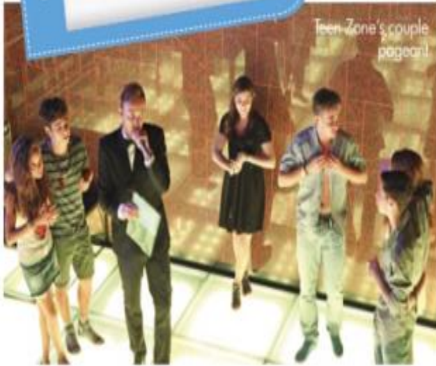
Teen-Zone's couple pageant!